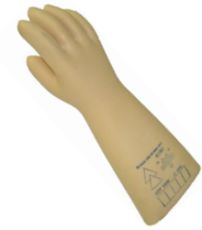
Tableau récapitulatif :